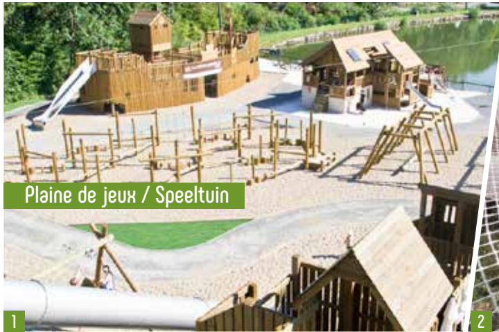
Plaine de jeux / Speeltuin

Met een toegangsbandje kan je deelnemen aan een waaier van activiteiten binnen ons park.