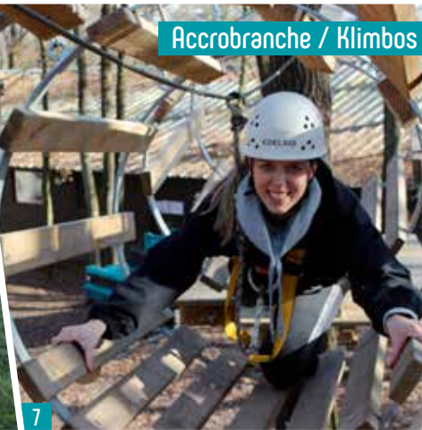
Accrobranche / Klimbos