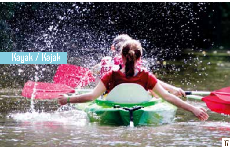
Kayak / Kajak