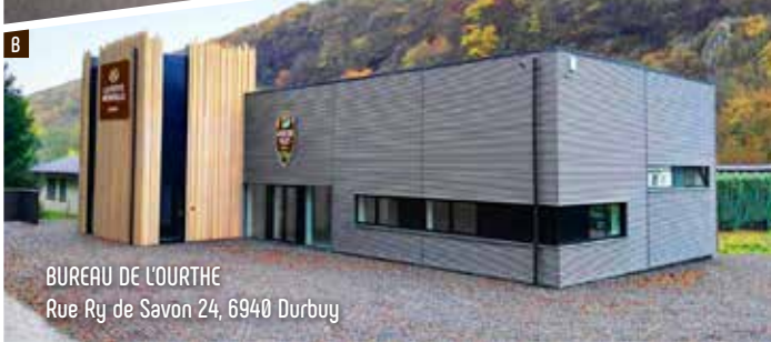
BUREAU DE L'OURTHE Rue Ry de Savon 24, 6940 Durbuy