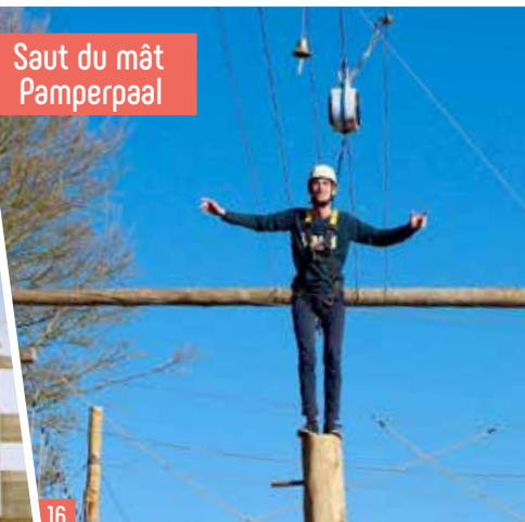
Saut du mât Pamperpaal