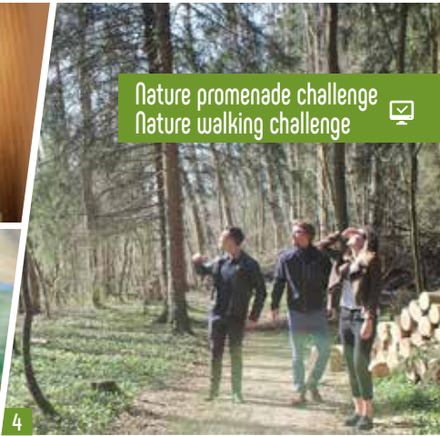
Nature promenade challenge Nature walking challenge