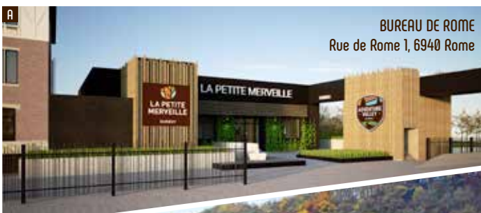
BUREAU DE ROME Rue de Rome 1, 6940 Rome

* + guide obligatoire : 250 €/jour et uniquement sur réservation + verplicht met gids: 250 €/dag en alleen op reservering