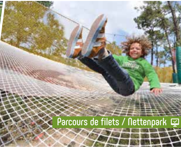
Parcours de filets / Nettenpark