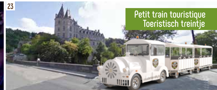
Petit train touristique Toeristisch treintje