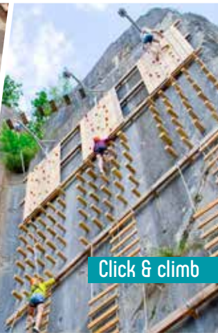
Click & climb